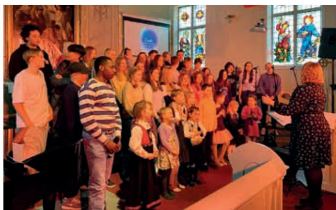
Konfirmantene sang sammen med barnekoret og minikoret.