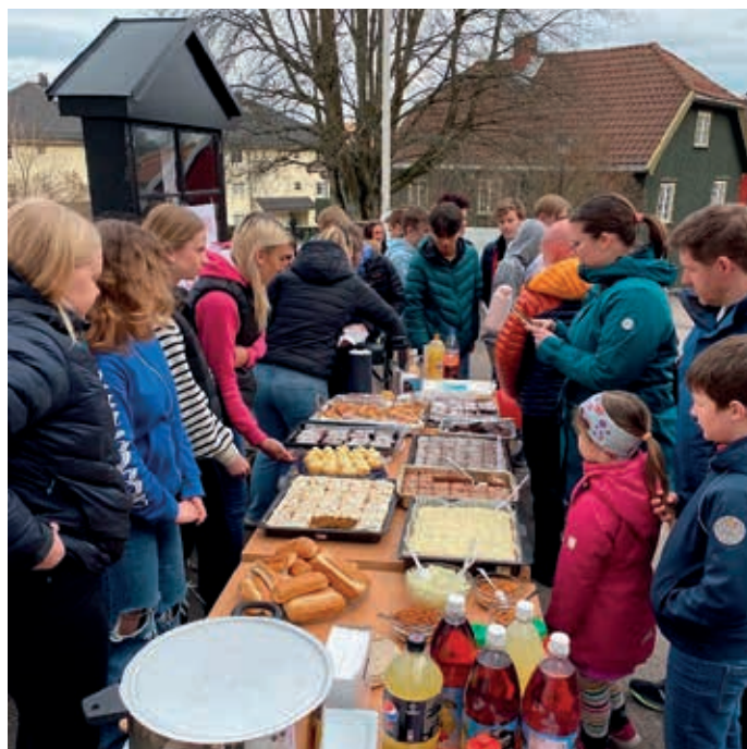
Konfirmantene solgte pølser, kaffe og kaker utenfor Holmestrand kirke.

Bakgrunnen for prosjektet er at Botne menighet har valgt å markere fastetiden med en innsamlingsaksjon til misjon- og bistandsorganisasjonen Himalpartner. Kor- og bandkonfirmantene har brukt mye av våren til å øve inn sangene. Globalkonfirmantene – den gjengen som har valgt å ha et ekstra søkelys på rettferdig fordeling, miljø og klima i konfirmasjonstiden – har brukt flere samlinger på planlegging av innsamlingsaksjonen. Alle gruppene har vært engasjert med å selge lodd, henge opp plakater og øve til forestillingen. Til sammen klarte konfirmantene å samle inn 19.760, noe vi er kjempefornøyd med.